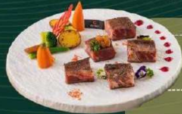
Bò lồi vai nướng