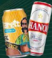
Local beer, craft beer