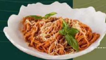
Mỳ Ý bò hầm