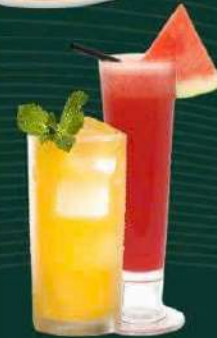
Nước ép (dưa hấu, chanh leo)