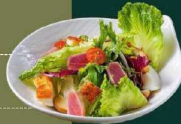
Salad hoàng gia