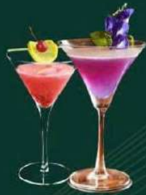
Cocktail (Classic cocktail)