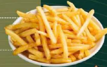
Khoai tây chiên